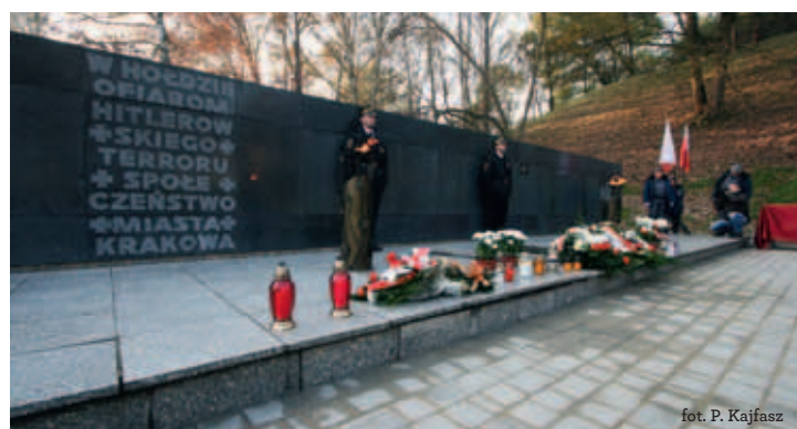
fol. P. Kajfasz