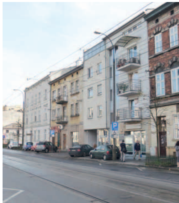
Ul. Kościuszki w podobnym w ujęciu jak na archiwalnej fotografii Agencji „Światowid”