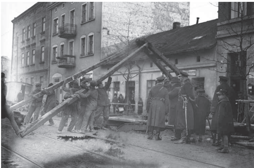
Ul. Kościuszki, w styczniu 1933 roku

Z punktu widzenia naszej rubryki ciekawy jest sztafajz tej fotografii. Dwie kamienice stoją-