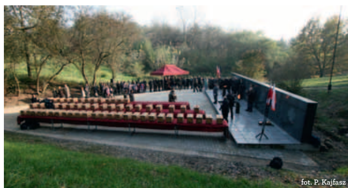
fol. P. Kajfasz