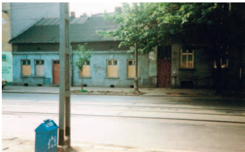
Dom przy ul. Kościuszki 44 czeka na egzekucję (fot. K. Jakubowski, 2000 r.)