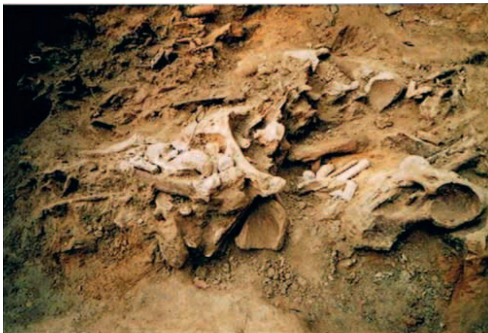
Nagromadzenie mamucich szczątków na stanowisku Kraków - Spadzista podczas prac wykopaliskowych w 2002 r.