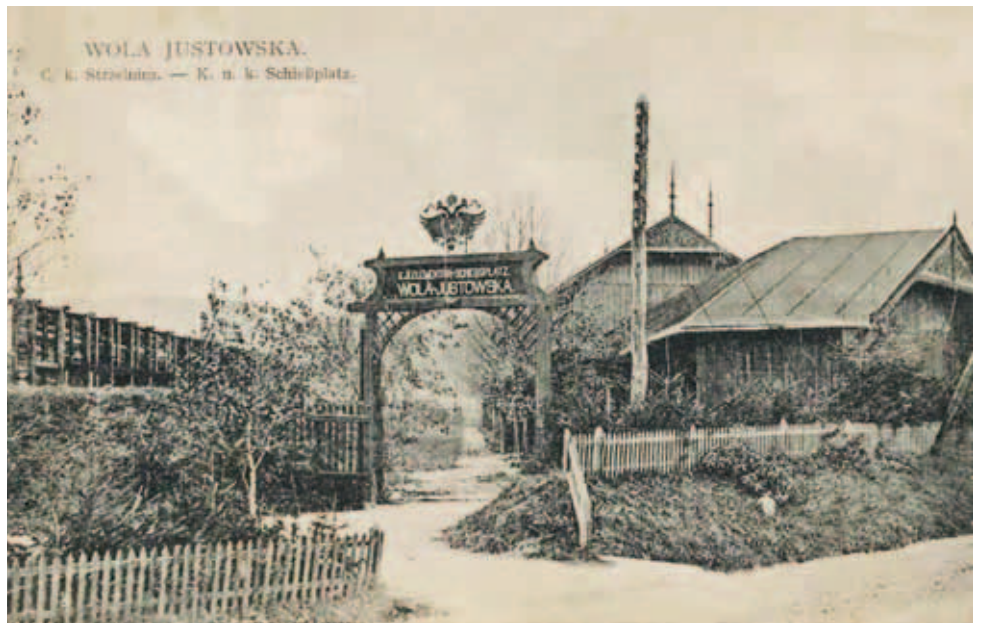
Strzelnica wraz z wejściem i przyległościami na widokówce z 1905 r.