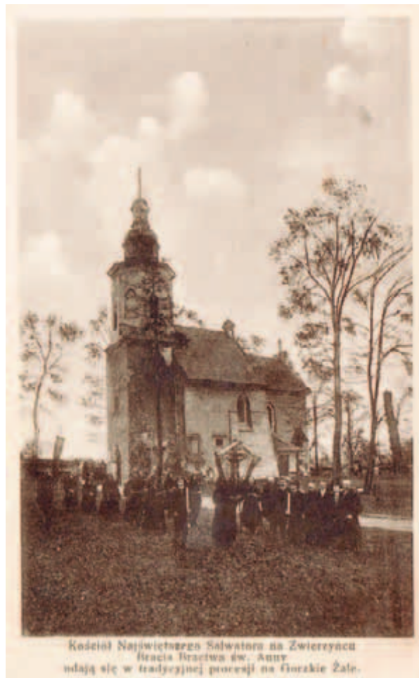
Widokówka wydana nakładem Bractwa św. Anny (1935 r.)

Na widokówce z 1935 roku podziwiać można nie tylko sam kościół i w tym tkwi jej oryginalność. Anonimowy fotograf utrwalił mianowicie osobliwe misterium – procesję towarzyszącą nabożeństwu zwanemu Gorzkie żale. Nabożeństwo to popularne – choć tylko w Polsce – odprawiane jest tradycyjnie w wielkopostne niedziele, od początków