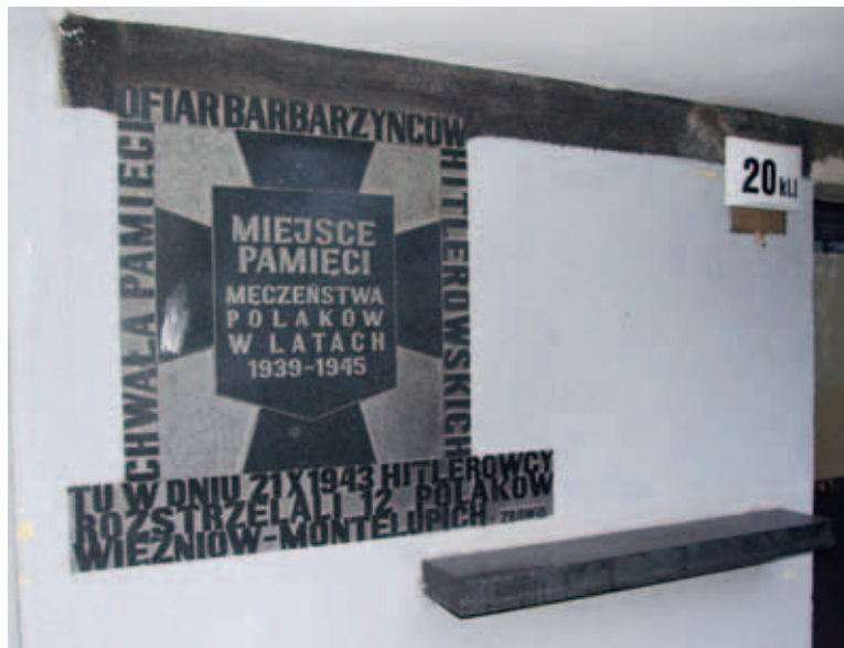
fol. P. Kajfasz

Zgodnie z wieloletnią już tradycją w przededniu Dnia Wszystkich Świętych uczniowie z Szkoły Podstawowej nr 31 wraz z przedstawicielami Rady Dzielnicy VII Zwierzyńiec przybywają na miejsce kaźni ofiar aby uczcić pamięć rodaków pomordowanych przez niemieckich okupantów. Oprócz symbolicznej wiązanki kwiatów składanej pod pamiątkową tablicą radni starają się przekazać zebranej młodzieży tragiczną historię tego