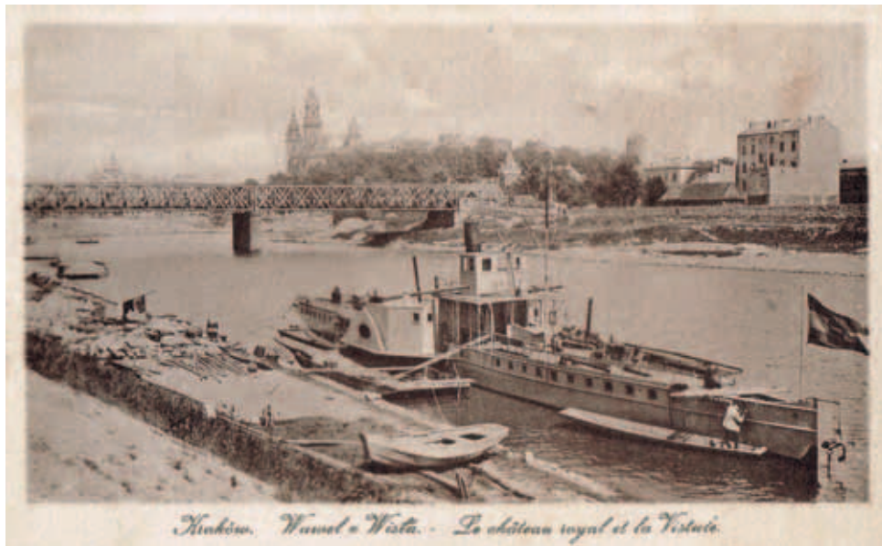
Widokówka przedstawiająca fragment wiślanego portu i most Dębnicki (1919 r.).

piach na galar, a później piaskarze rozwozili go taczkami po specjalnych pomostach, wprost na wozy.