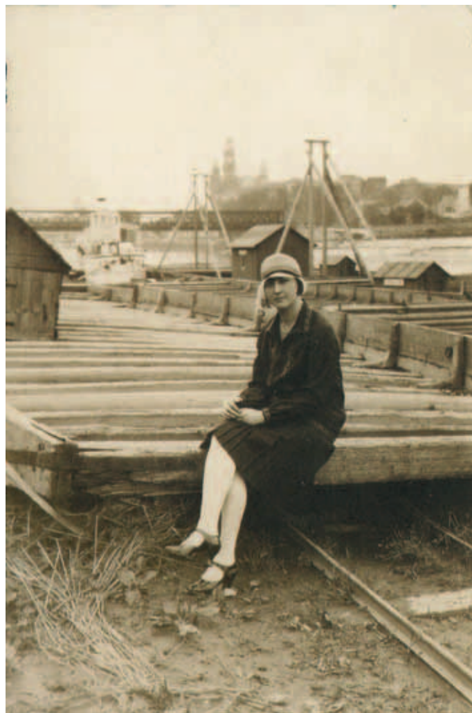
Wiślany port na prywatnej fotografii, wykonanej - sądząc po kreacji pozującej damy - w drugiej połowie lat 20..

Z kolei nadbrzeże pomiędzy Rudawą, a ul. Dojazdową opanowane było przez pracujących w pocie czoła piaskarzy. Najpierw, przez całe dziesięciolecie ten ceniony budowlany surowiec wydobywany był z dna rzeki ręcznie. Dopiero w latach 30. pojawiły się pogłębiarki z czerpakowym kołem wyrzucające