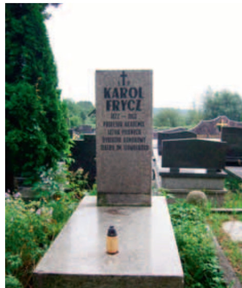
Grób Karola Frycza na Cmentarzu Salwatorskim