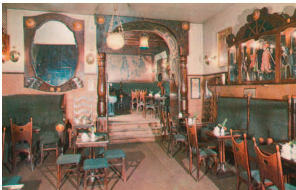
Wystrój Jamy Michalika – Nieśmiertelne dzieło Karola Frycza