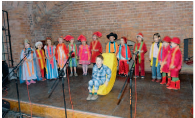
fol. S. Malik

Święto tradycyjnie rozpoczęły występy artystyczne dzieci z placówek oświatowych zlokalizowanych na terenie dzielnicy. Kolejno prezentowały się przedszkolaki z Przedszkola nr 9, a następnie dzieciaki z anglojęzycznego przedszkola „Clever Kids” z Woli Justowskiej. Kolejnym z występów był chór ze Szkoły Podstawowej nr 31. Pokazem tańca zaprezentował się Klub Kultury Przego-