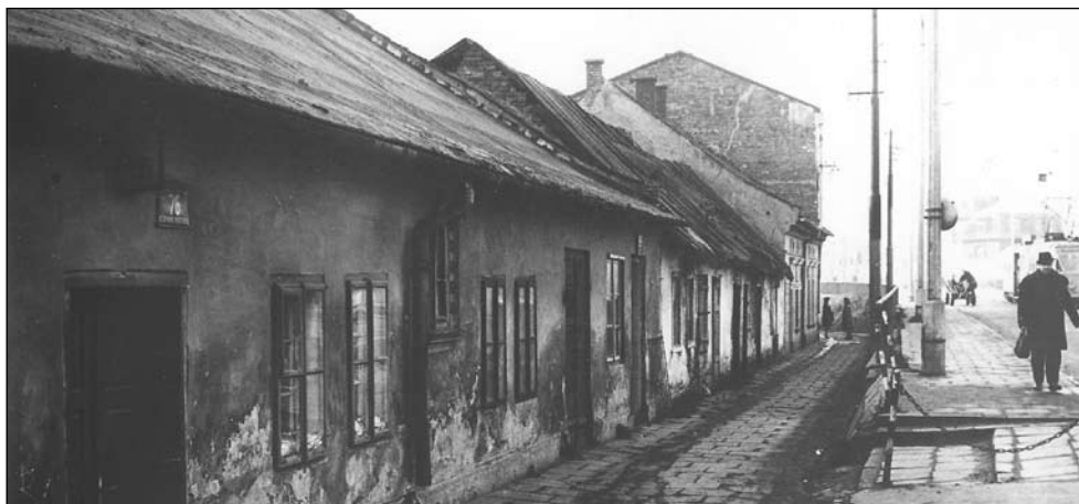
Ul. Kościuszki - z wyburzoną ok. 1970 r. pierzeją domów (nr 76-80). Nie zmieścił się tu w kadrze budynek dawnej karczmy z początku XIX w. (nr 74) zamykający narożnik z ul. Flisacką. Fot. z połowy lat 60-tych XX w. Z Archiwum Dokumentacji Mechanicznej.

Wszystkie znaki na niebie i ziemi zdają się wskazywać, że niebawem znikną z pejzażu miasta i dawnego Półwsia Zwierzynieckiego znaczące fragmenty parzystej części ul. Kościuszki. Ta wytyczona jeszcze w średniowieczu droga, prowadziła niegdyś tylko do klasztoru Norbertanek i kościoła Salwatora, później przedłużono ją w kierunku Bielani i przeprawy do Tyńca. W połowie XIX wieku przebudowana ul. Kościuszki stała się ważnym ze względów strategicznych połączeniem pomiędzy fortyfikacjami powstającej wówczas twierdzy Kraków. Główna arteria Półwsia Zwierzynieckiego zyskała wówczas charakter podmiejskiej alei obsadzonej obustronnie zielenią, z niską, parterową zabudową. Przez długi czas najwyższym budynkiem ulicy był piętrowy, XVII-wieczny Dwór Łowczego - dziś zgrabnie zaadaptowany przez Wydawnictwo Znak. Począwszy od lat siedemdziesiątych XIX stulecia zaczęto stawiać przy ulicy domy piętrowe, około roku 1900 pojawiać zaczęły się nieśmiało dwupiętrowe, a tuż przed wybuchem pierwszej wojny światowej zabudowa sięgała w nielicznych przypadkach nawet trzech pięter. Ożywiony ruch budowlany dotknął też wytyczone w sąsiedztwie ulice, a rzecz miała już ścisły związek z przyłączeniem Półwsia do Krakowa, usankcjonowaną umową z 1 kwietnia 1910 roku.