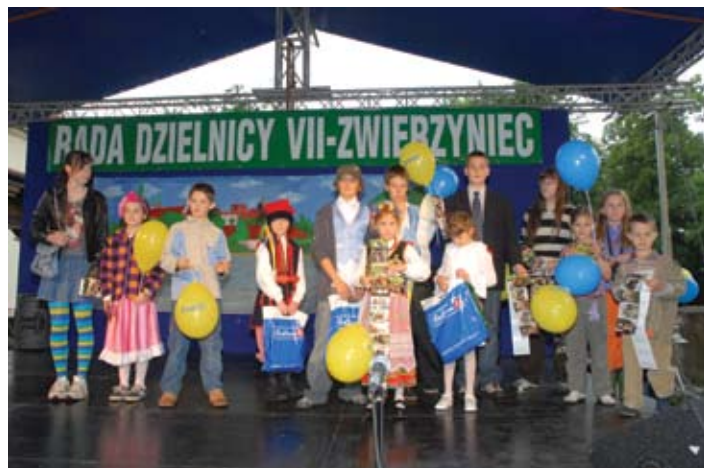
Jedne z prezentacji przygotowanych przez przedszkolaki.