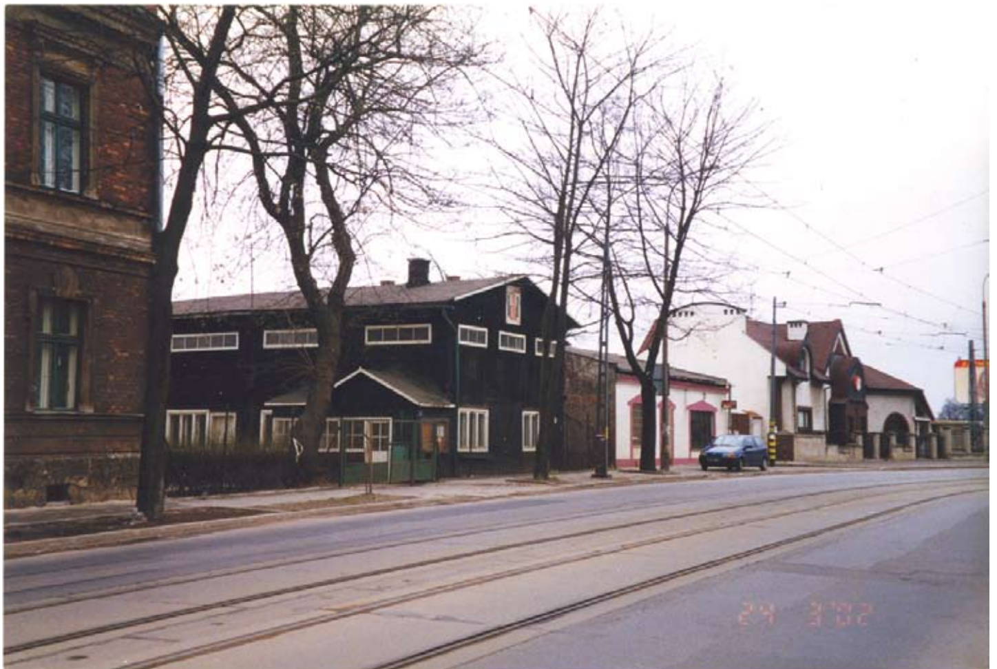
Rok 2002 – drewniany budynek TKKF-u stoi jeszcze w niezłej kondycji... Za nim zagrożony prawdopodobnie także budynek nr 70 oraz nowy dom nr 72 gdzie planowane jest podwyższenie o dwie kondygnacje....