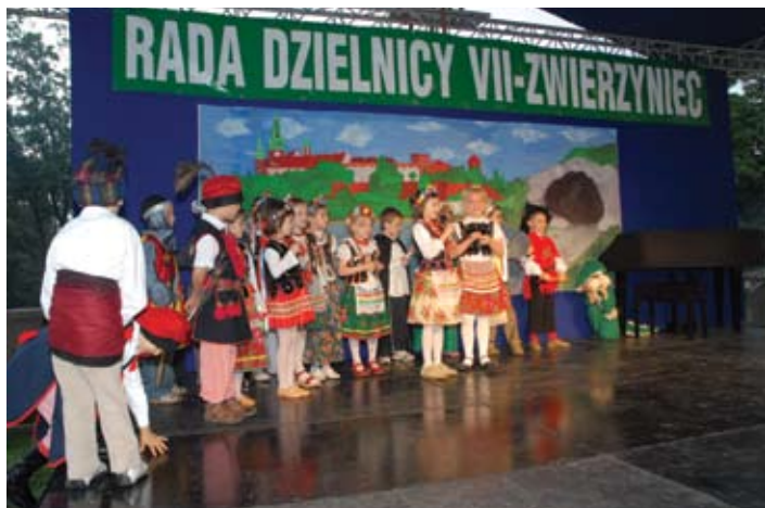
Rozdanie nagród w konkursie plastycznym „Krakowskie ZOO”.