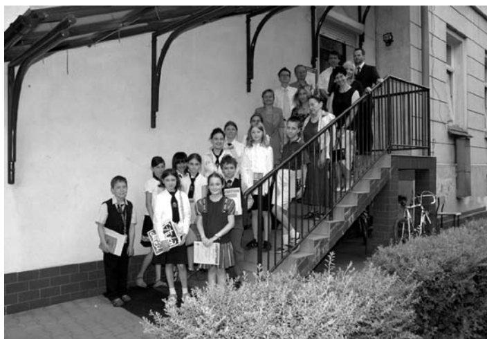
Laureaci, pedagodzy i jury pod siedzibą Rady.