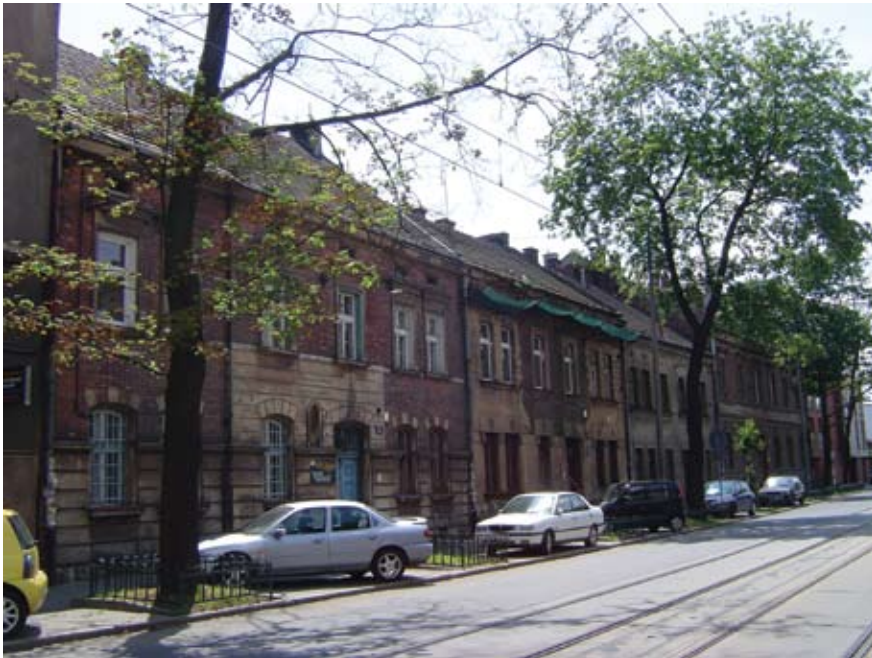
Ul. Kościuszki - na pierwszym planie po lewej przeznaczony do wyburzenia budynek, gdzie mieściła się poczta. Posiada on ciekawą, kombinowaną fasadę z licowanej czerwonej cegły i tynku, okna zamknięte odcinkowymi łukami i ładną stolarkę bramy. Powstał ok. 1905 r.