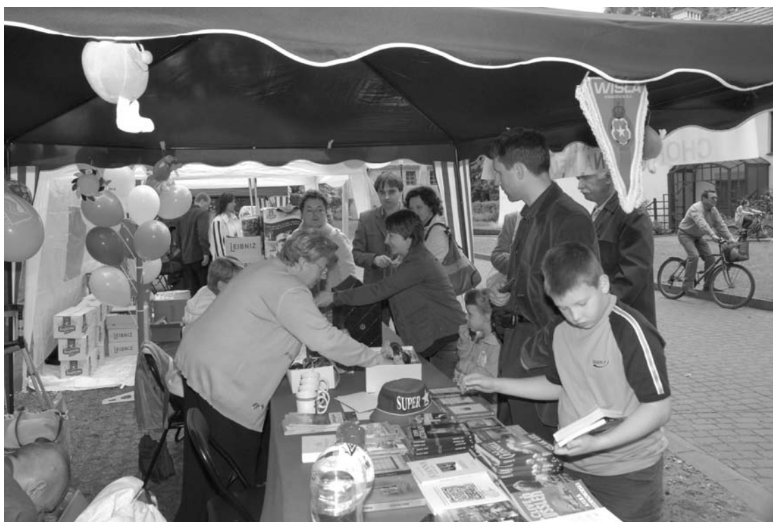
Przy stoliku loterii fantowej zorganizowanej przez Stowarzyszenie Chorych na Reumatyzm ciągle było tłoczno.